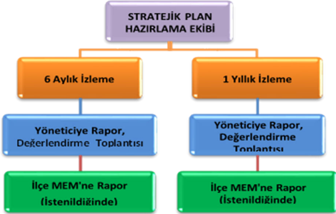
Şekil 3: İzleme ve Değerlendirme Süreci

Müdürlüğümüzün 2019-2023 Stratejik Planı İzleme ve Değerlendirme sürecini ifade eden İzleme ve Değerlendirme Modeli hazırlanmıştır. Müdürlüğümüzün Stratejik Plan İzleme- Değerlendirme çalışmaları eğitim-öğretim yılı çalışma takvimi de dikkate alınarak 6 aylık ve 1 yıllık sürelerde gerçekleştirilecektir. 6 aylık sürelerde rapor hazırlanacak ve değerlendirme toplantısı düzenlenecektir. İzleme-değerlendirme raporu, istenildiğinde İlçe Milli Eğitim Müdürlüğü'ne gönderilecektir. Ayrıca ilçemizin Mülki İdari Amirine sunulacaktır. 1 yıllık izleme-değerlendirme çalışmaları, Stratejik Planımızda yer alan hedeflerin yıllık düzeyde ifade edildiği Performans Programı ve yılsonunda gerçekleşme düzeylerinin belirlendiği Faaliyet Raporu hazırlanarak yapılacaktır.